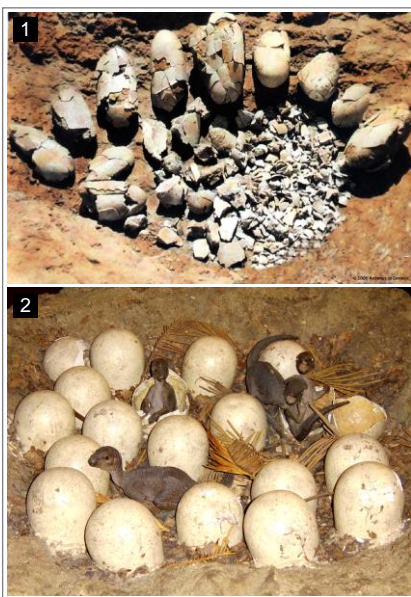
图 1： 恐龙蛋化石。 图 2： 艺术家模拟的小恐龙出壳。恐龙出壳时非常小。五岁以后才快速生长。挪亚带上方舟的应该是幼龙。注释 1

大家都是挪亚的后代，因而我们预计能在最远古的文明和种族中找到一些关于大洪水的文化记忆。结果的确发现了！