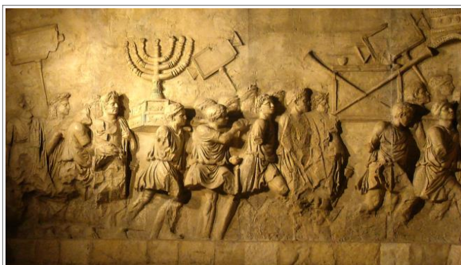
公元 70 年攻下耶路撒冷后，罗马皇帝提图斯建了一座凯旋门庆功。这座凯旋门今天依然坐落罗马。上图是凯旋门上的浮雕复制品的一个部分。留意一下图中从圣殿抢掠的战利品——七连灯台。注释 1

有时你会听人说，这些预言是自行应验的。他们说，犹太人在圣经中读过这些预言，因而刻意去应验这些预言。这个观点可信吗？犹太人的圣殿和都城被毁，几十万的犹太人被屠杀，生还者被卖为奴隶，最后他们都被赶出了以色列。难道这些都是犹太人为了应验摩西的预言而特意安排的吗？