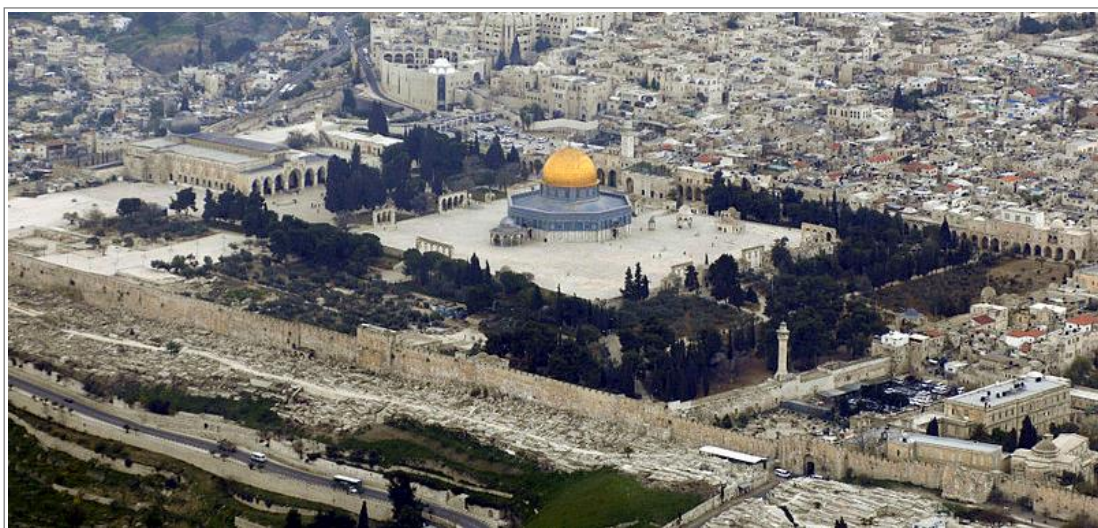
今天的耶路撒冷圣殿山。金色圆顶建筑是穆斯林的圆顶清真寺（奥玛清真寺），位于犹太人的圣殿遗址上。注释 1

但是耶稣给这个情况定了期限：“直到外族人的日期满足”。我们或许会自然而然地认为期限已到，因为犹太人在 1967 年已控制了耶路撒冷。只是，犹太人还未能控制耶路撒冷最重要的区域：圣殿山，也就是耶和华的圣殿在公元 70 年被毁前所坐落的位置。自公元 686 年以来，犹太人古老的圣殿遗址一直被穆斯林的圆顶清真寺（又称奥玛清真寺）占据，穆斯林将它视为继麦加和麦地那之后的第三大圣地，因他们认为这里正是穆罕默德有一晚在