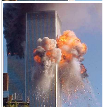
9·11 恐怖袭击的恐怖分子声称他们在反抗巴勒斯坦受到的不公。注释 1

的正当理由，而的确，美国从最开始就卷入了阿以问题。于是，如圣经所预言，一个如此强大的远方的国家在搬起耶路撒冷这块“沉重的石头”时，都难免受“重伤”！