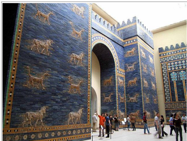
在德国柏林博物馆里的巴比伦伊斯塔（Ishtar）门复原品。注释 1