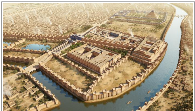
艺术家绘制的鼎盛时期的巴比伦。注释 1

巴比伦坐落在幼发拉底河的下游，这为灌溉用水的稳定供应提供了保证。周围的冲积平原布满了纵横交错的水渠，这一来能为肥田里的庄稼提供充足的水源，二来又便于出产品的运输。同时，幼发拉底河连着波斯湾，有助于跨国贸易。到公元前 600 年，耶利米时代为止，巴比伦城