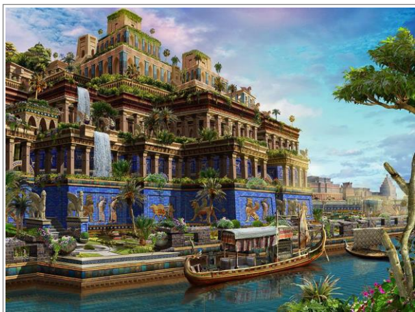
艺术家构想的空中花园。注释 1

至少已有 1200 多年的历史。以人的角度来看，这座城市理所当然会一直发展下去。我们要知道，当时的人在城市选址上极其谨慎。城市能发展主要取决于经久不衰的自然优势，例如良好的水源供应和便利的交通。这也是为什么耶利米时代的很多其他大城市，即使遭到侵略甚至有时彻底被毁，还能存留至今。今天，大马士革仍是叙利亚的首都，阿曼仍是约旦的首都，西顿仍是黎巴嫩的都城，耶路撒冷又是以色列的首都，西安和洛阳也仍是中国的大都市，这类例子不胜枚举。在以赛亚和耶利米的时代，人们绝对不会想到长久繁荣的巴比伦会成为荒地。