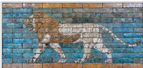
彩釉砖块上的巴比伦狮子。注释 1

第一个帝国，也就是异象中塑像的“金头”，明确是指尼布甲尼撒王时代的巴比伦帝国：“你就是那金头” [但以理书 2:38]。这一帝国是由尼布甲尼撒王的父亲在公元前 626 年建立的，一直延续到公元前 539 年。我们现在讲的这三个异象，都是但以理在这一巴比伦帝国时期内领受的。