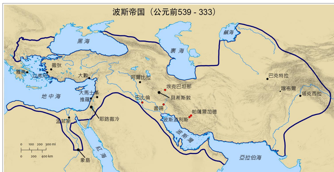
玛代波斯帝国地图。注释 1