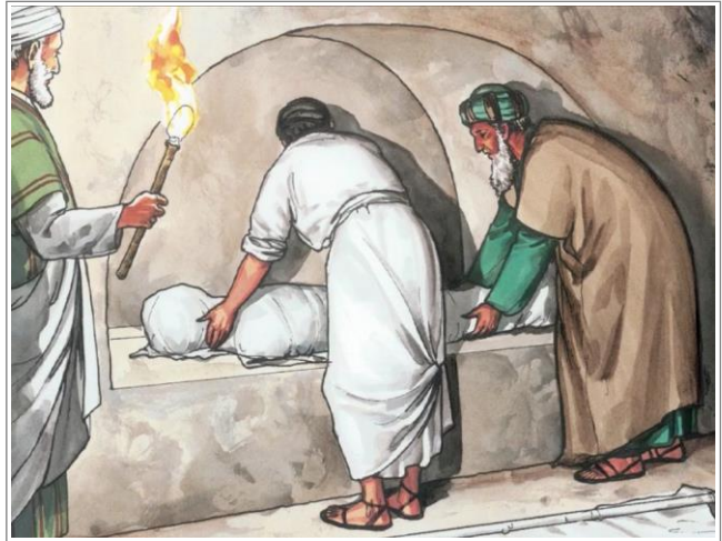
艺术家构想的耶稣埋葬时的情形。注释 1

合物渗进麻布条内，黏着尸体和其他布条。这一道程序完成后，尸体从肩到脚看上去像个木乃伊，头部则用另一块布包裹[约翰福音 11:44、20:7]。当然这些布条会紧黏在一起，形成一个包裹着尸体的囊壳。 199, 200, 201 还记得拉撒路从死里复活时，他解不开自己身上的裹尸布。[约翰福音 11:44]