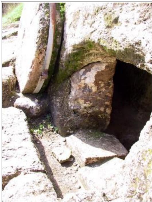
离耶路撒冷不远的一世纪坟墓，侧图展示出洞口供石头滚入的槽沟。（注意：钢带是近代添加的。）注释 1