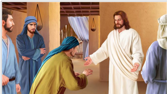
艺术家构想的托马斯检验耶稣伤痕的情景。注释 1

我们千万不要误解耶稣对多马的这番话。看看这里的情境，耶稣并不是在说“盲目相信我复活的人有福了”，而是说“根据神所提供的有力证据，在亲自看见我之前就相信我复活的人有福了。”多马在亲眼见到耶稣之前，已有充足的证据能相信祂的确复活了。他读过旧约圣经的预言，听过耶稣自己的预言，他见过耶稣施行的神迹，还有至少十七人的见证， 205 这些人都是他所熟知、明知能信得过的人。这里耶稣是在责备多马不愿考虑他已有的证据，从而得出合理的结论。