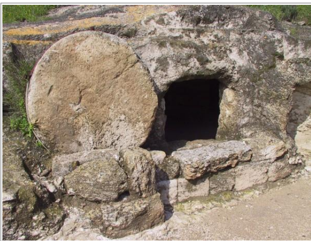
耶路撒冷附近第一世纪的坟墓。留意左边可以滚动的石门。注释 1

这些受到惊吓的妇人从天使听到耶稣已经复活的消息后，就回去找门徒。这里要特别注意两点：预言和疑惑。天使提醒她们，要回想耶稣亲口预言过自己的死和复活。预言前半部