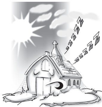
图11 · Caleb Salisbury