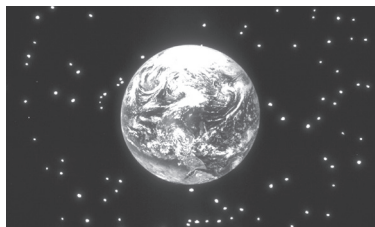
神六日内创造万有 (出埃及记20:8-11)

打个比方。当你启动文件处理程式，屏幕只出现一个空白的文件档。如果你把文件的内容全部删除，屏幕也只会出现空白的文件档。可以说，“空白”的意思是“没有任何文字”。有时候，因为你没有写上什么，所以没有文字；也有时候是文字被删除所致。因此，在诠释“空白”一词时，需要参照上下文去作判断，“空白”本身不能给你说明什么。套入这个比方，