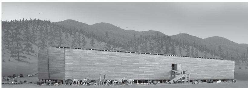
挪亚把神领来的各类有呼吸空气机能的陆上动物带进方舟，免遭大洪水灭命

在这些经文中，个别译为“牲畜”或“畜类”的这个词在希伯来原文都是 behemah ，指的是普遍的陆上脊椎动物。“昆虫 / 爬行动物”这个词是 remes ，在圣经中有多种不同的含义，但此处大概是指爬行动物 (reptiles)。 3 挪亚不需要带海洋生物 4 上船，因为它们不一定受到大洪水威胁而灭绝。然而，混合着沉积物的汹涌波涛会导致大量生物灭绝，正如在化石记录中所见到的，许多海洋物种可能因为大洪水而绝种。倘若神凭祂的智慧决定不让一些海洋生物存留，这并不是挪亚的责任。