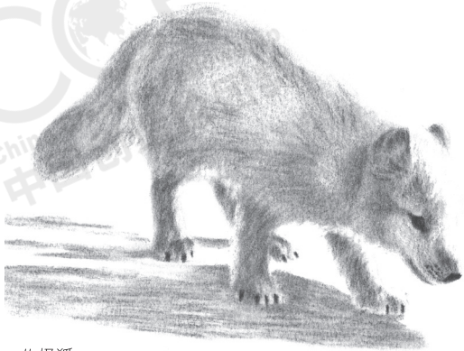
炭笔画 · Robert Smith

今天，冰川流动时会磨蚀所经过的岩石，形成粗幼混杂的沉积物。当混杂的物质组成一个岩石单位，就称为冰碛土 (till) 或冰碛岩 (tillite)。当冰川在基岩 (bedrock) 上流动，嵌入冰川内的岩石跟基岩发生碾磨作用，刻出一些平行沟槽，称为擦痕 (striations)。夏季冰雪融化时，原本藏在冰川内如粉末状的“岩屑”就会释放出