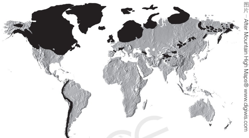
冰河时期的高峰期，冰盖大约的覆盖范围

美国北部)，以及从斯堪的纳维亚半岛 (Scandinavia) 至德国和英格兰的北欧地区 (见下图)。