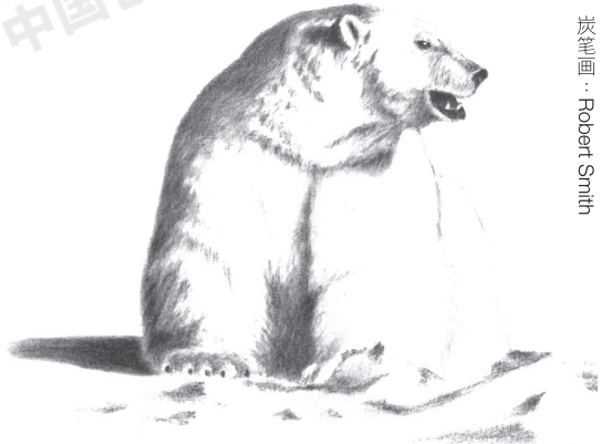
炭笔画 · Robert Smith

有趣的是，这个冰河时期似乎可以引用圣经旧约《约伯记》(37:9-10；38:22-23、29-30)